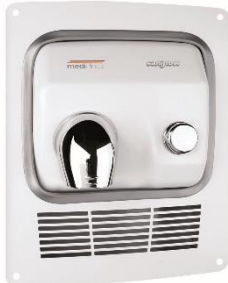
KT0005 Acabado blanco