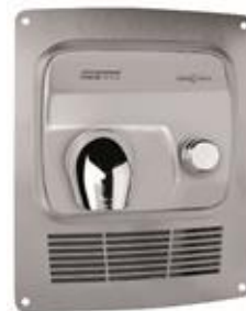
KT0005CS Acabado satinado