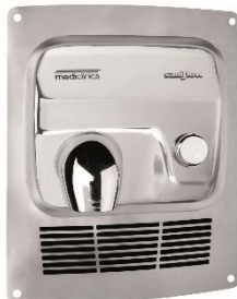
KT0005C Acabado brillante