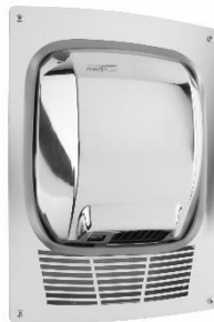
KT0010C Acabado brillante