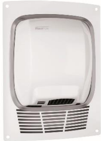
KT0010 Acabado blanco