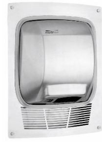
KT0010CS Acabado satinado