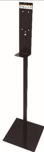
HGPT0020B Acabado negro mate