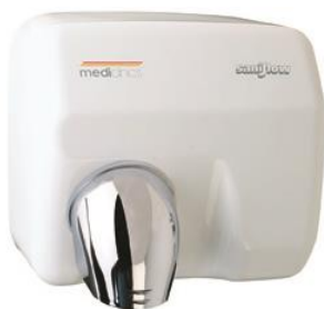
E05A Acabado blanco