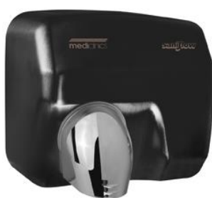
E05AB Acabado negro mate