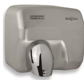
E05ACS Acabado satinado