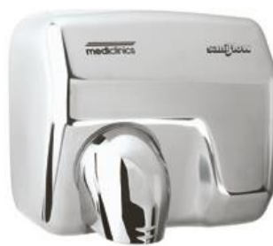
E05AC Acabado brillante