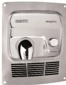
KT0005C Glänzende Oberfläche