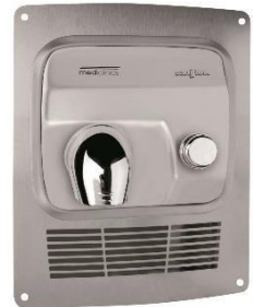
KT0005CS Satinierte Oberfläche