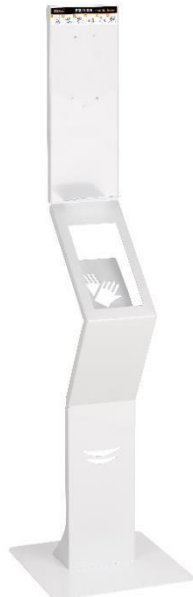
HGPT0040 Weißes Epoxyd