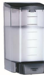
DJ0020F Acabado negro fumé