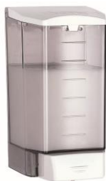
DJ0010F Acabado blanco fumé