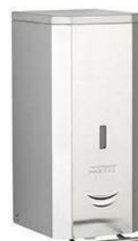
DJP0034CS/DJFP035CS/ DJSP036CS Acabado satinado