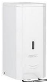
DJP0034/DJFP035/ DJSP036 Acabado blanco