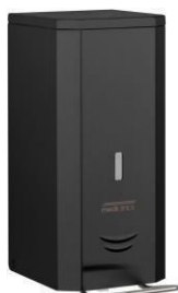
DJP0034B/DJFP035B/ DJSP036B Acabado negro mate