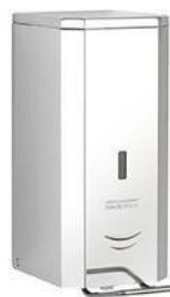
DJP0034C/DJFP035C/ DJSP036C Acabado brillante