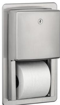
PRE700CS acabado satinado