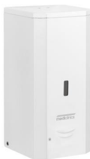
DJF0038A Weißes Epoxyd