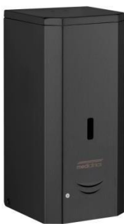
DJF0038AB Mattschwarzes Epoxyd