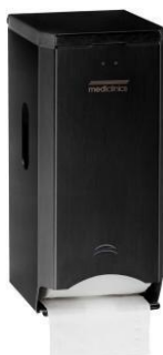
PR2784B Schwarzes Epoxyd