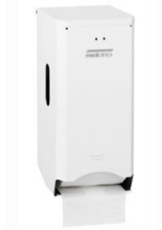
PR2784 Weißes Epoxyd