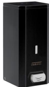
DJS0033B Mattschwarzes Epoxyd