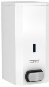
DJS0033 Weißes Epoxyd