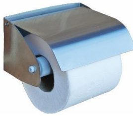
AI0129CS Acabado satinado