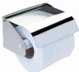
AI0129C Acabado brillante