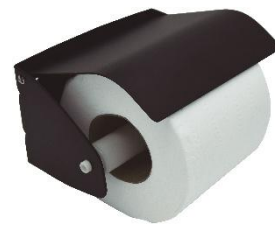
AI0129B Acabado negro