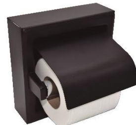
AI0310B Acabado negro