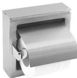
AI0310CS Acabado satinado