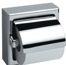
AI0310C Acabado brillante