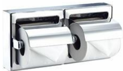
AI0320C Acabado brillante