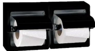
AI0320B Acabado negro