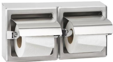
AI0320CS Acabado satinado