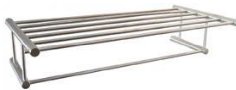
AI0040CS Acabado satinado