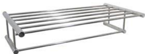
AI0040C Acabado brillante