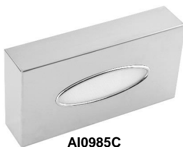
AI0985C Acabado brillante