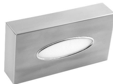
AI0985CS Acabado satinado