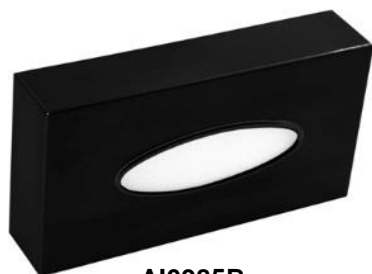
AI0985B Acabado negro mate