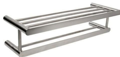
AI1323CS Acabado satinado