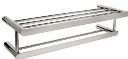
AI1323C Acabado brillante