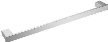
AI1413C Acabado brillante