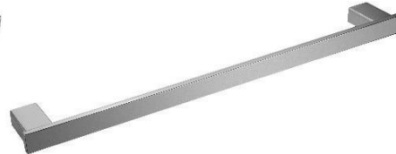
AI1413CS Acabado satinado