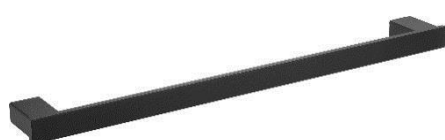
AI1413B Acabado negro