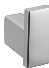
AI1418CS Acabado satinado