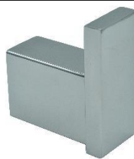
AI1418C Acabado brillante