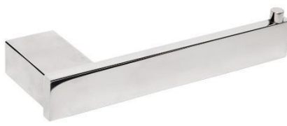
AI1421C Acabado brillante