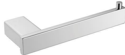
AI1421CS Acabado satinado