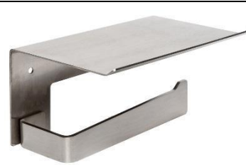
AI2003CS Acabado satinado