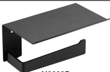
AI2003B Acabado negro