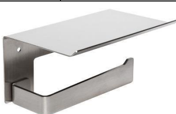
AI2003C Acabado brillante