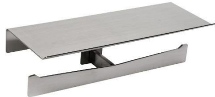
AI2004CS Acabado satinado