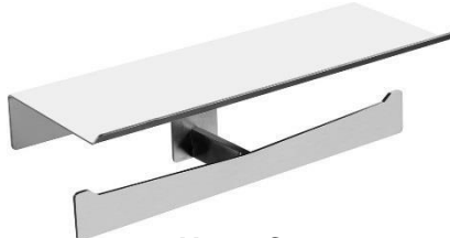
AI2004C Acabado brillante