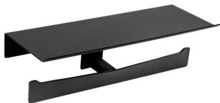
AI2004B Acabado negro mate