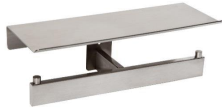
AI2006CS Acabado satinado