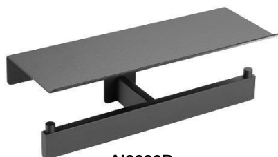
AI2006B Acabado negro