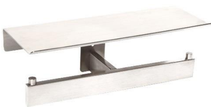
AI2006C Acabado brillante