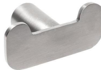
AI2318CS Acabado satinado