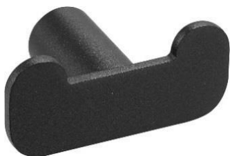
AI2318B Acabado negro