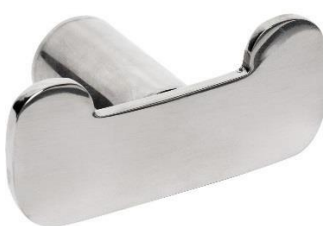
AI2318C Acabado brillante