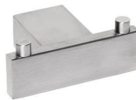
AI2418CS Acabado satinado