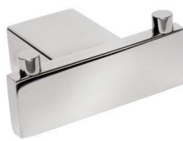
AI2418C Acabado brillante