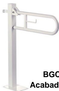
BGC2710 Acabado blanco