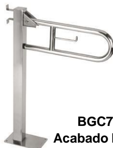
BGC710C Acabado brillante