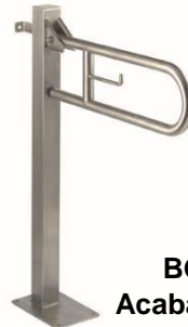
BGC710CS Acabado satinado