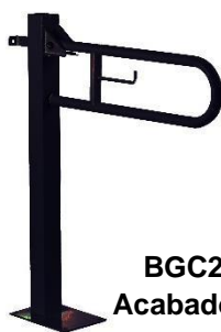
BGC2710B Acabado negro