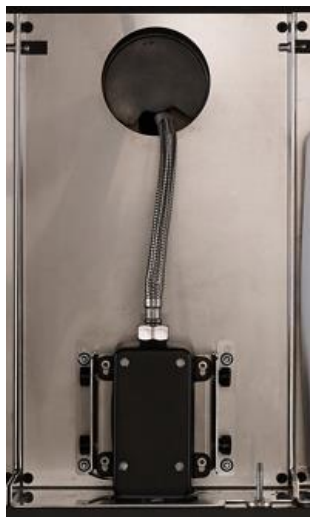
Grifo de agua: GA024BTM Acabado negro