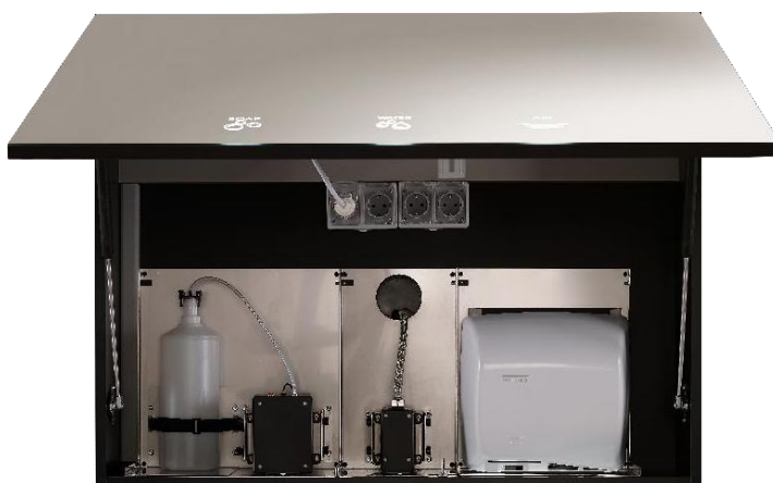
Código del conjunto completo: BTM02