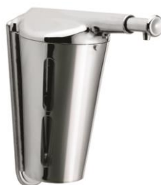
DJ0110C Acabado brillante