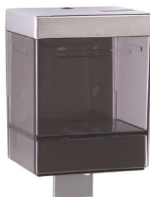
DJ0515F Acabado negro fumé