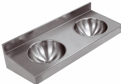
SN0200CS Acabado satinado