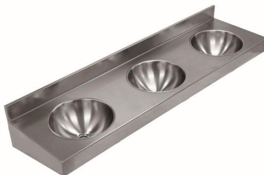
SN0300CS Acabado satinado