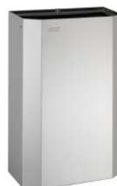
PPA2212CS Acabado satinado