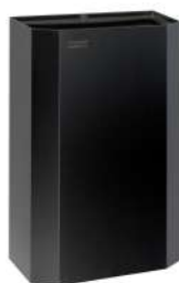
PPA2212B Acabado negro