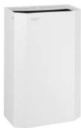
PPA2212 Acabado blanco