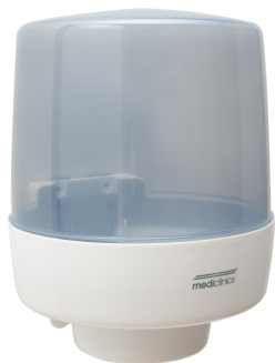
DT0601 PP blanco/azul