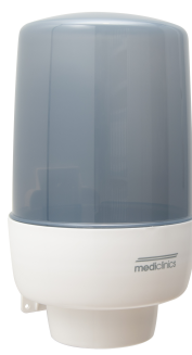
DT0602 PP blanco/azul