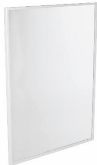
EP0350 / EP0450 Weiß

Fest montiert mit einem Rahmen aus Stahl oder Edelstahl AISI 304