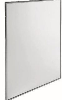
EP0350CS / EP0450CS Satinier