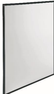
EP0350B / EP0450B Mattschwarz