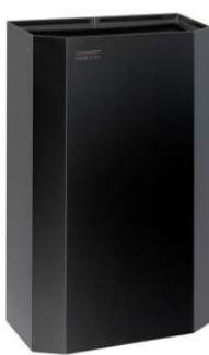
PPA4279B Acabado negro mate