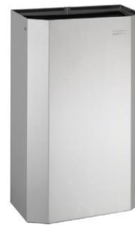
PPA4279CS Acabado satinado