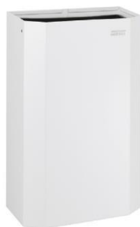
PPA4279 Acabado blanco