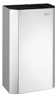
PPA4279C Acabado brillante