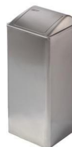
PP0065CS / PP0080CS Finish: Seidenmatt