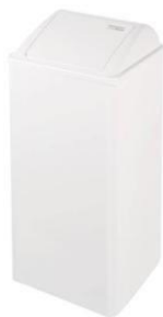
PP0065 / PP0080 Finish: Epoxid weiß