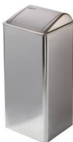
PP0065C / PP0080C Finish: Glänzend