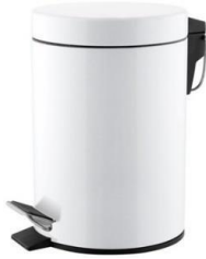
PP1303/PP1305/PP1312/ PP1321 Weiß