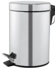
PP1303C/PP1305C/PP1312C/ PP1321C Glänzend