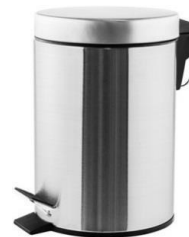
PP1303CS/PP1305CS/PP1312CS/ PP1321CS Satiniert