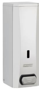
DJ0040C Acabado brillante