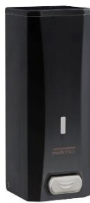
DJ0040B Acabado negro mate