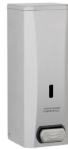
DJ0040CS Acabado satinado