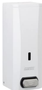
DJ0040 Acabado blanco